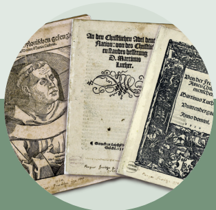
2020: Die Formulierung der Reformation. Luthers Hauptschriften des Jahres 1520