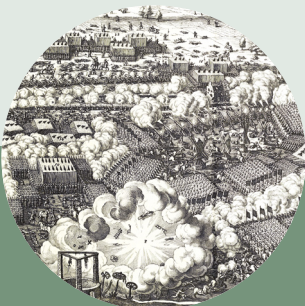
2018: Der gedruckte Krieg