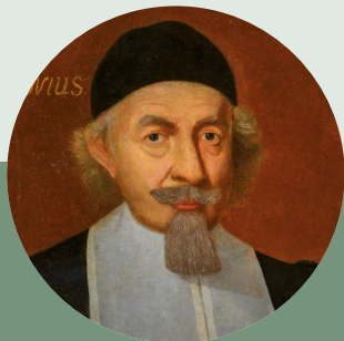
2019: Beharrung und Aufbruch - Abraham Calov und das Luthertum nach dem Dreißigjährigen Krieg