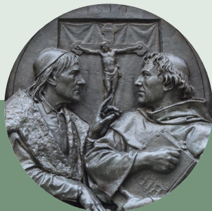
2019: Wortgefechte – Die Leipziger Disputation und die religiöse Streitkultur des 16. Jahrhunderts

TERMINE 11. Oktober 2023, 16.00 und 18.00 Uhr RFB, Besprechungsraum (mit Anmeldung)