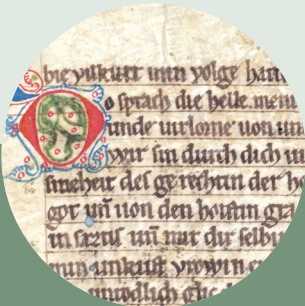
2020/2022: Wiederverwendet. Wiederentdeckt. Mittelalterliche Handschriftenfragmente als Bucheinbände